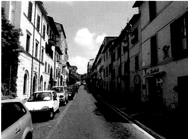
■ Una via del centro storico di Grottaferrata