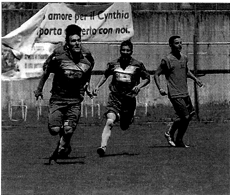
■ Un'esultanza dello Sporting Genzano

Vagliate le richieste e stilate le famigerate graduatorie al termine dei campionati della passata stagione, il Consiglio Direttivo del Comitato Regionale del Lazio ha reso noti gli organici delle società partecipati al prossimo campionato di Promozione 2015/16. Le novità più intriganti sono rappresentate dal Racing Club, che dopo aver rilevato il titolo del Torvaianica si presenta ai nastri di partenza con ambizioni importanti, e la Fortitudo Academy, nata dalla fusione tra la Fortitudo Velletri ed il Città di Monterotondo, dal quale ha ereditato il titolo. C'è grande curiosità anche intorno ai due club di Fiumicino ripescati: l'Aranova parteciperà per la prima volta alla seconda serie regionale e si sta già muovendo da tempo sul mercato grazie ai buoni uffici con il Fregene, il Fiumicino 1926, invece, rimane in Promozione nonostante la retrocessione dello scorso anno e proverà a fare tesoro degli errori commessi nella passata stagione. Nello stesso girone, presumibilmente, ci